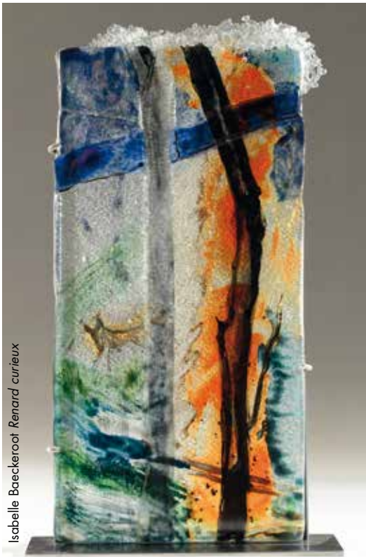
Isabelle Baeckeroot Renard curieux