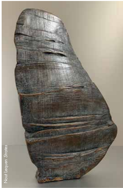
Nout Lequen Strales