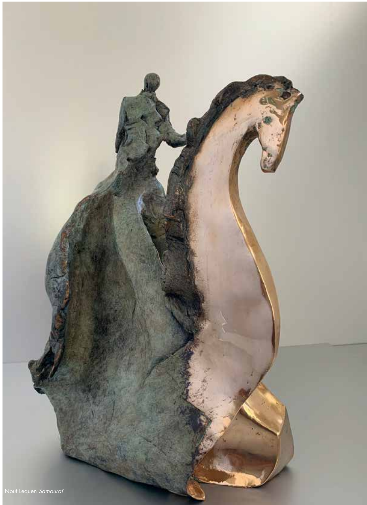
Nout Lequen Samourai