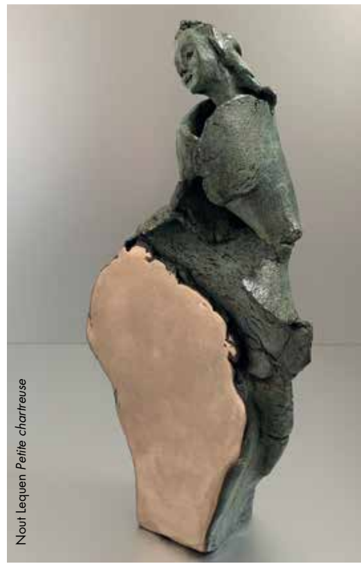
Nout Lequen Petite chartreuse