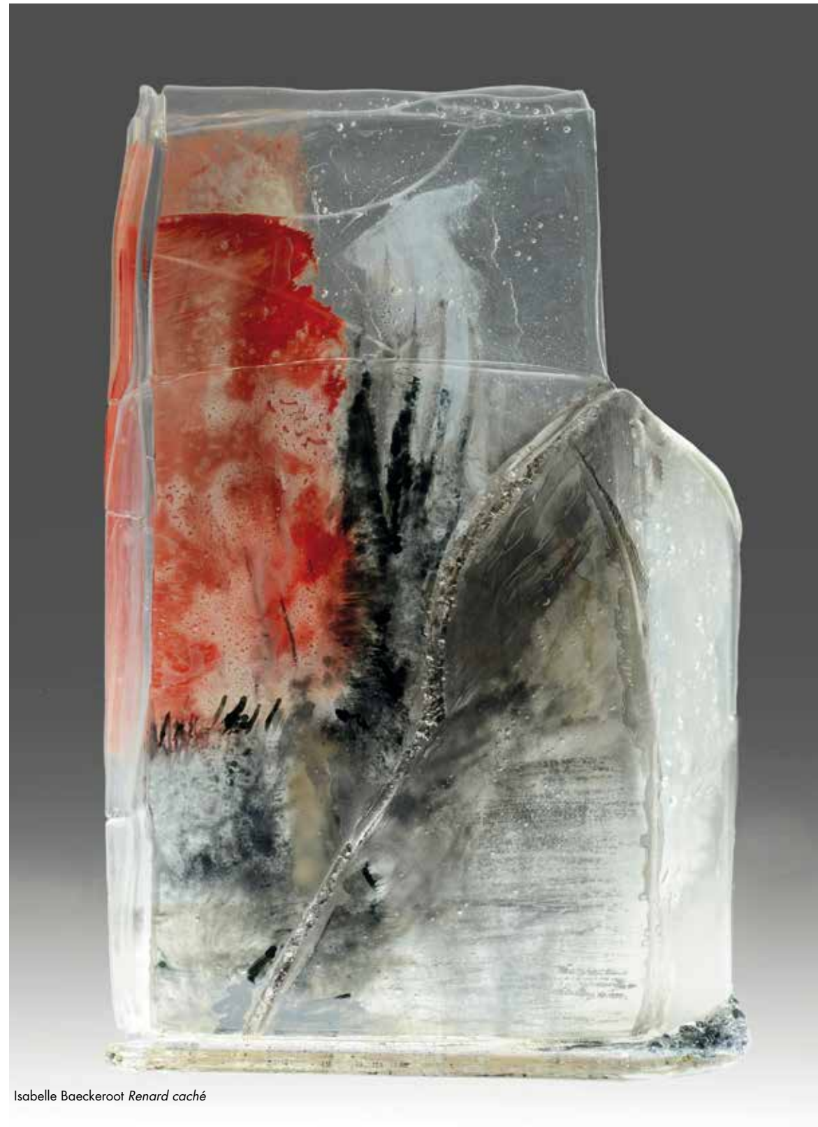
Isabelle Baeckeroot Renard caché