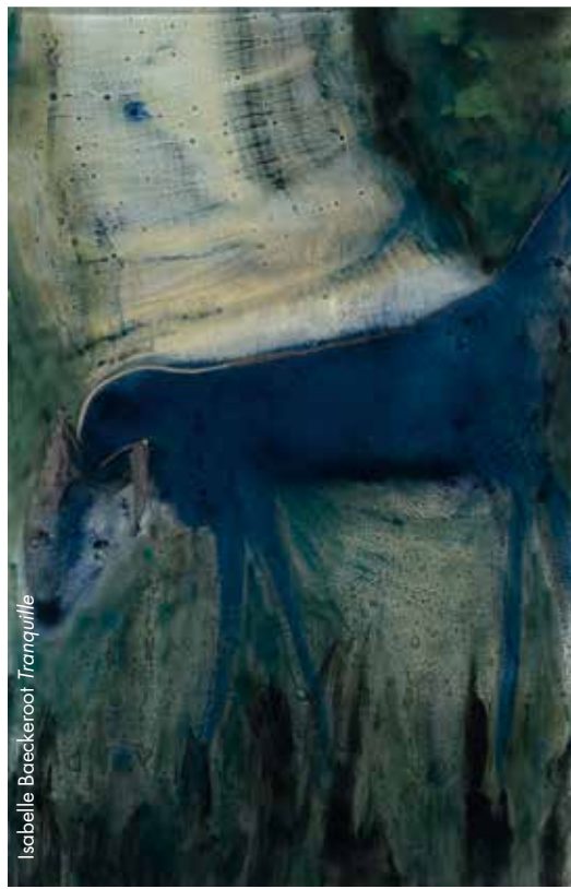
Isabelle Baeckeroot Tranquille