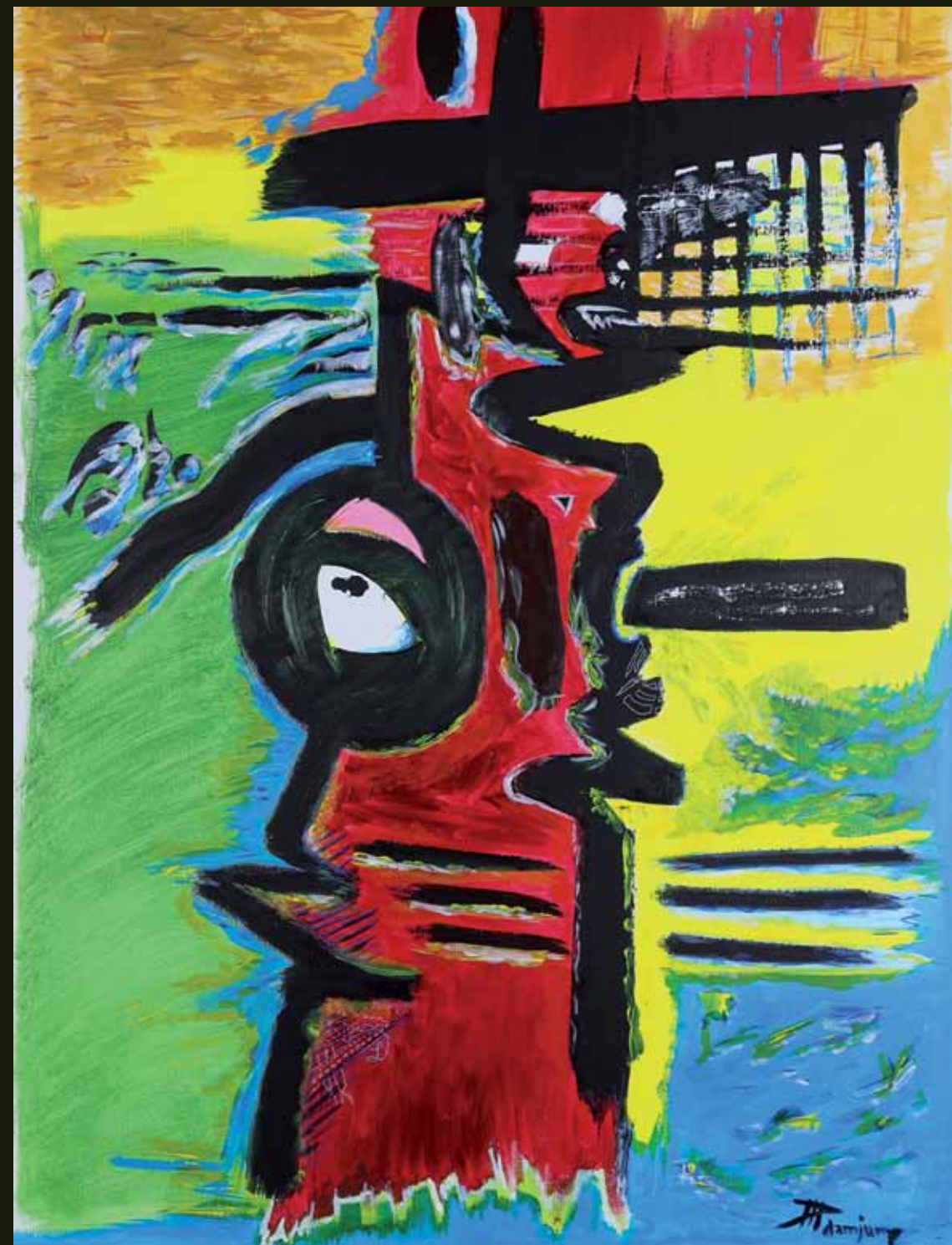
Muchacho - 2020