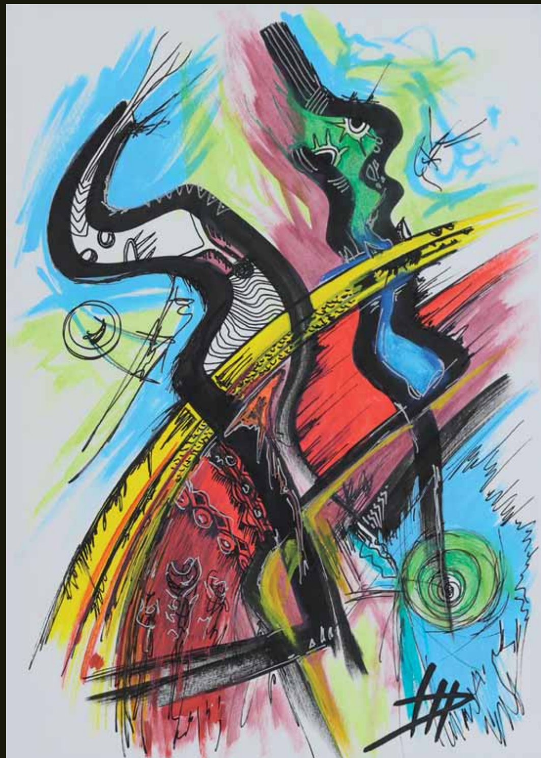
Sparkling water - 2019