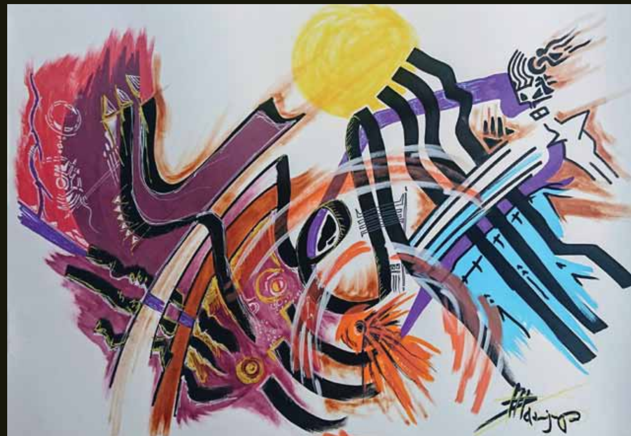
La caverne de Platon - 2019

Le climat et son réchauffement nous impactent déjà et vont encore plus le faire dans les années qui viennent. Sensibiliser les jeunes et leur montrer les effets et les marges de manœuvre me semble essentiel. L'art est pour moi le vecteur idéal pour commencer à «faire ensemble» et donc sortir du choc traumatique dû à l'immensité de ce qui est à accomplir pour sauver le vivant et l'humanité.