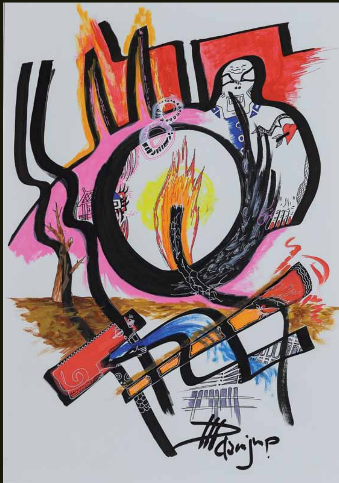
House is burning - 2020

[espace] ARAGON EXPOSITION DU 4 FÉVRIER AU 18 MARS 2022 19 IS BD. JULES FERRY 38190 VILLARD-BONNOT TÉL. 04 76 71 22 51 WWW.ESPACE-ARAGON.FR