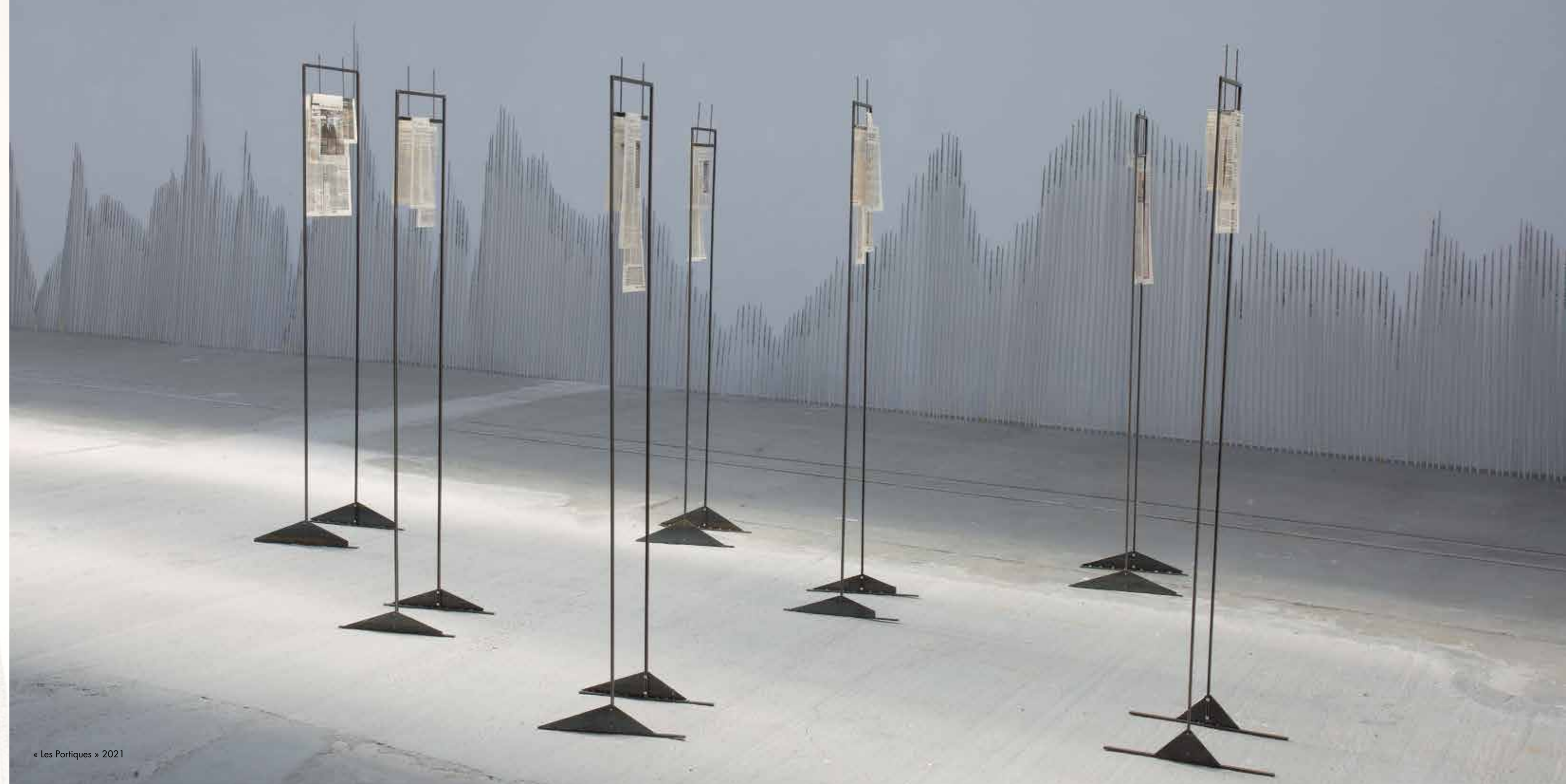
« Les Portiques » 2021