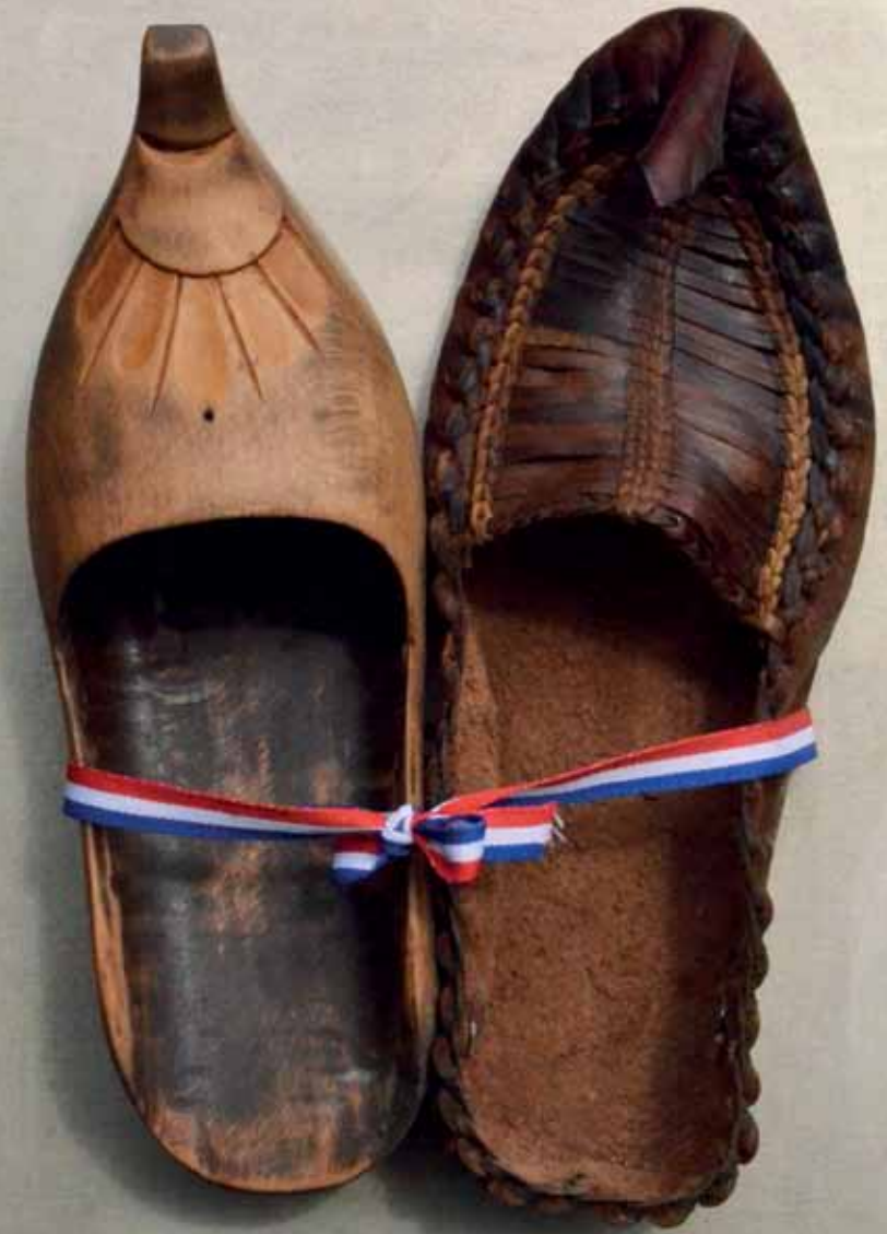
NOUS SOMMES LA SOMME DE NOUS