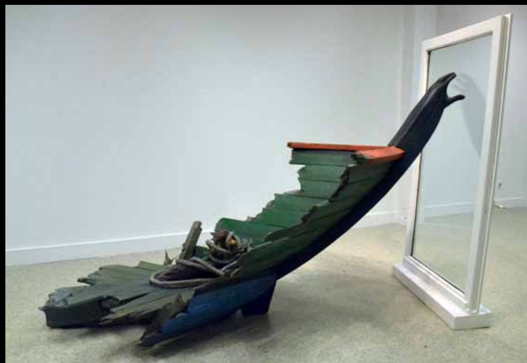
« Migration »