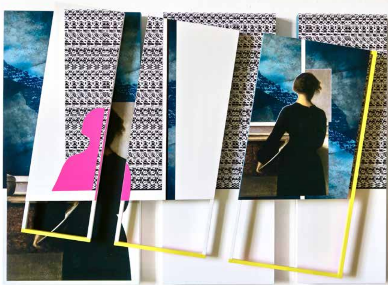
Danish woman in black&pink , 2021, technique mixte, 85 x 62 x 5 cm, collection privée