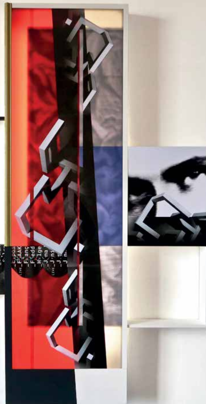
Brèves histoires à géométrie variable