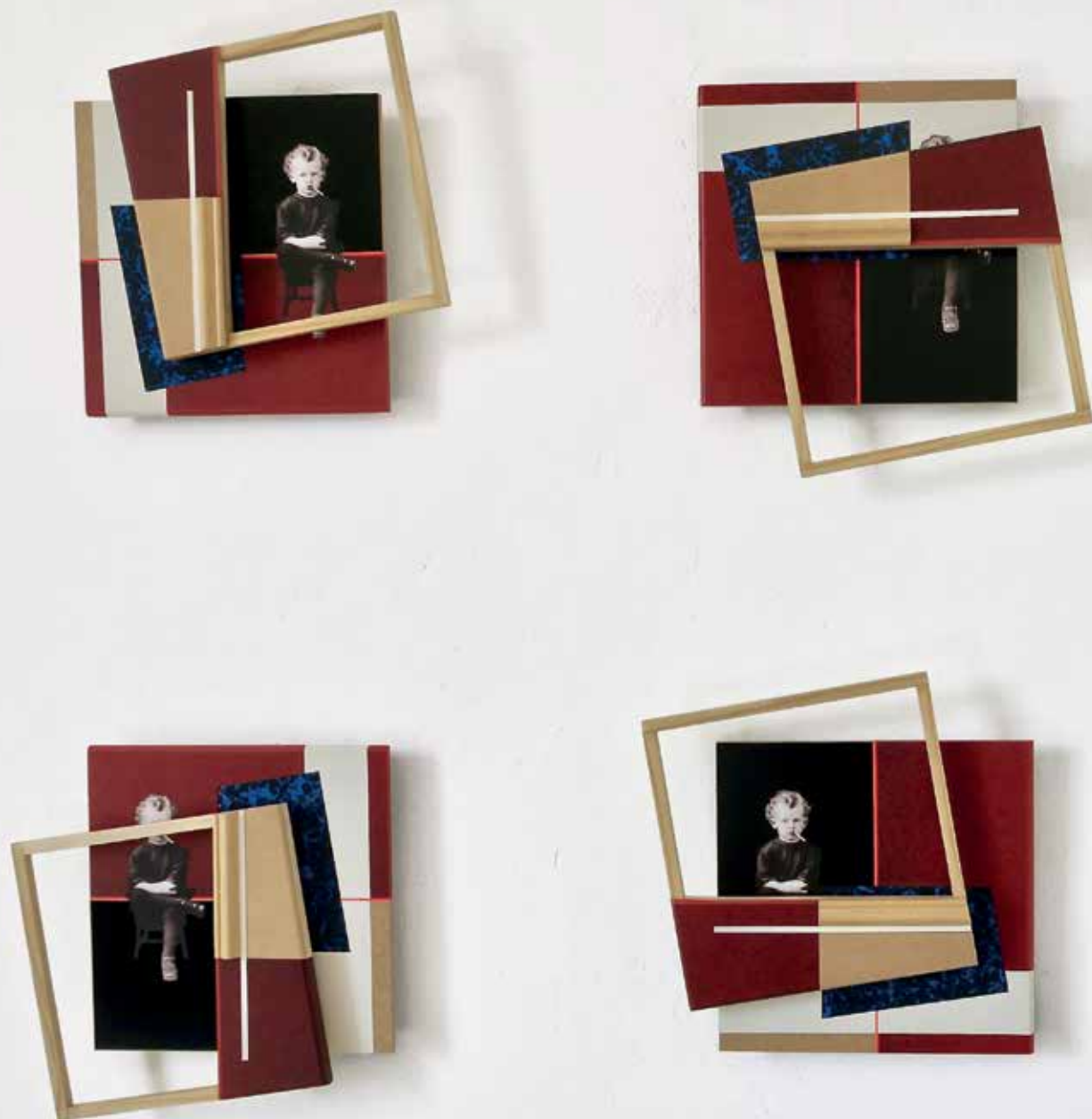
La rotation des carrés, 2023, 4 carrés 27 x 27 x 5 cm chacun