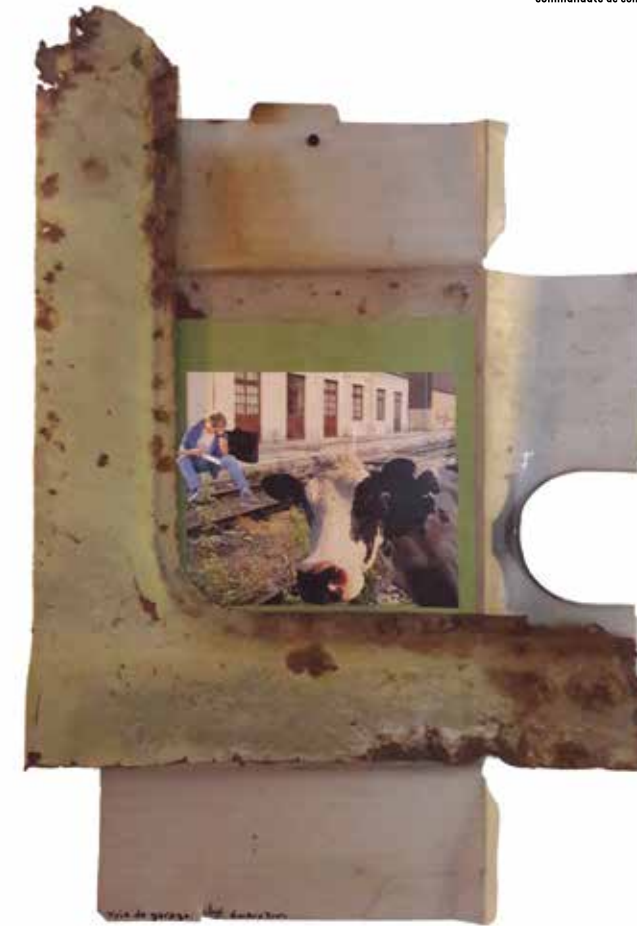
Voie de garage (6 mars 2004. Papier, métal rouillé, papier)