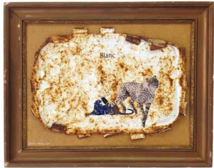
Blanc casse toi (25 mai 2006. Bois, métal rouillé, papier)