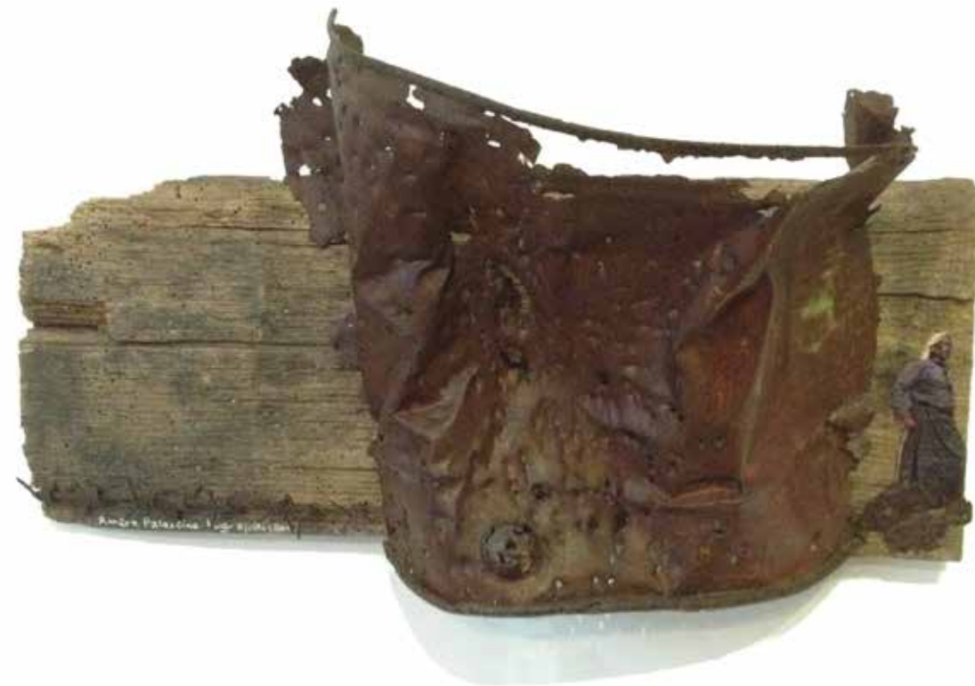
Amère Palestine (9 juillet 2012. Bois, métal rouillé, barbelés rouillés du camp de Rivesaltes, papier)