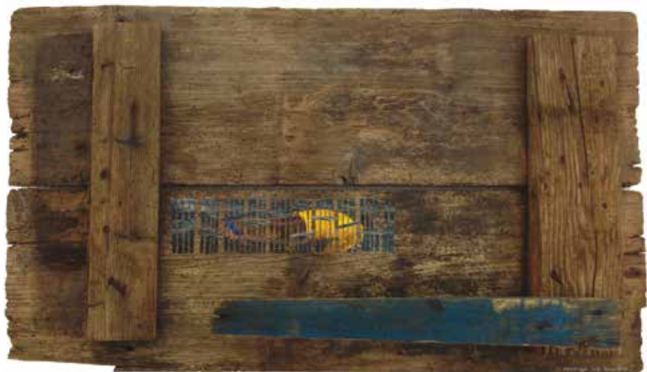
noSfrages (9 mai 2015. Bois, papier, clous rouillés)