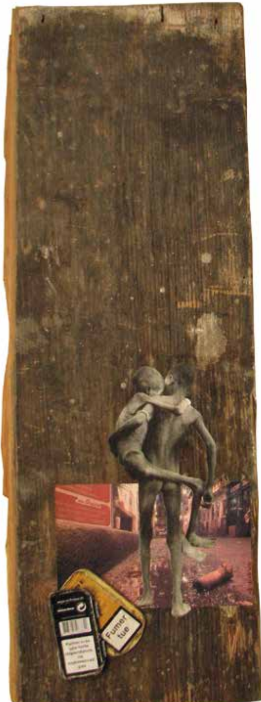
Faire chier pue (18 avril 2010. Bois, métal, papier)