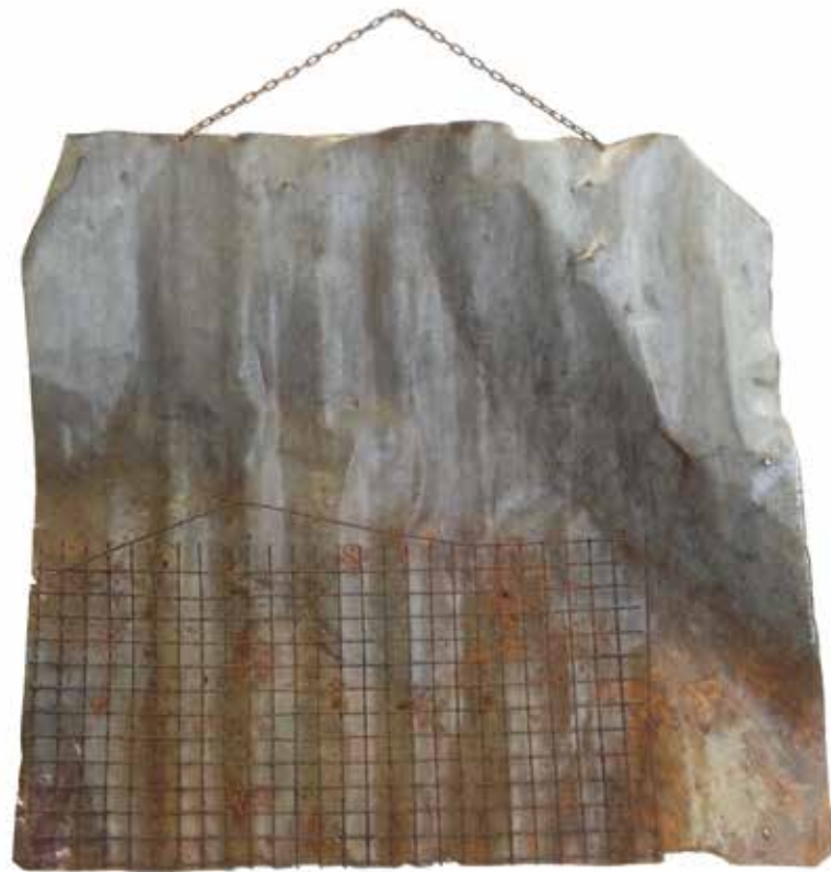
Enchaînés de tous les pays déchainez-vous (8 mars 2013. Tôle et grille rouillées, papier)