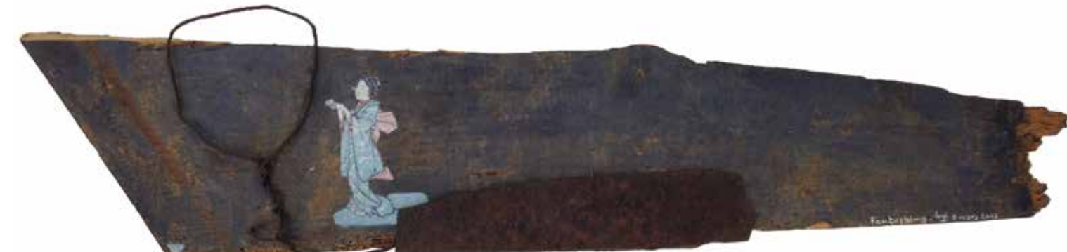
Foutushima (3 mars 2013. Bois, métal rouillé, papier)