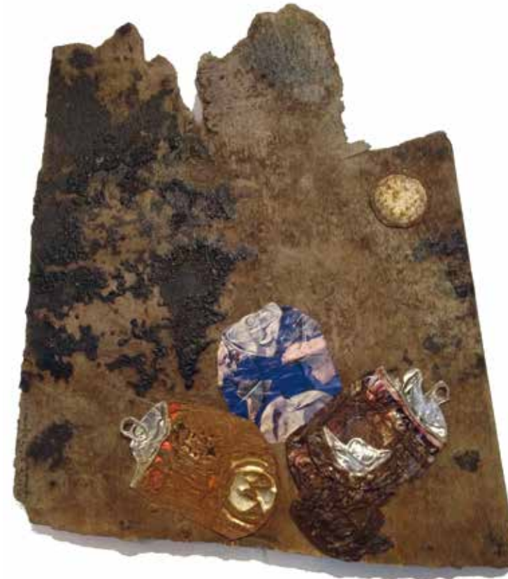
Tout un monde qui cane net (17 novembre 2012. Bois, canettes rouillées, papier)