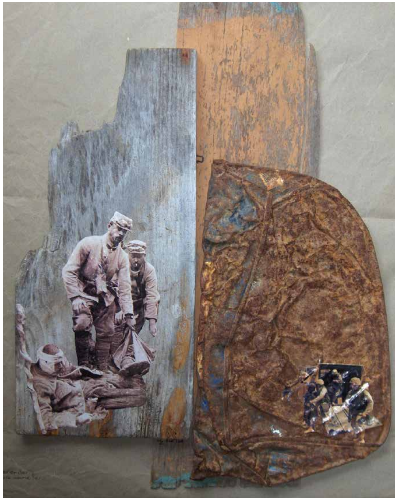
de der en der, ça dure comme fer (8 octobre 2006. Bois, métal rouillé, papier)