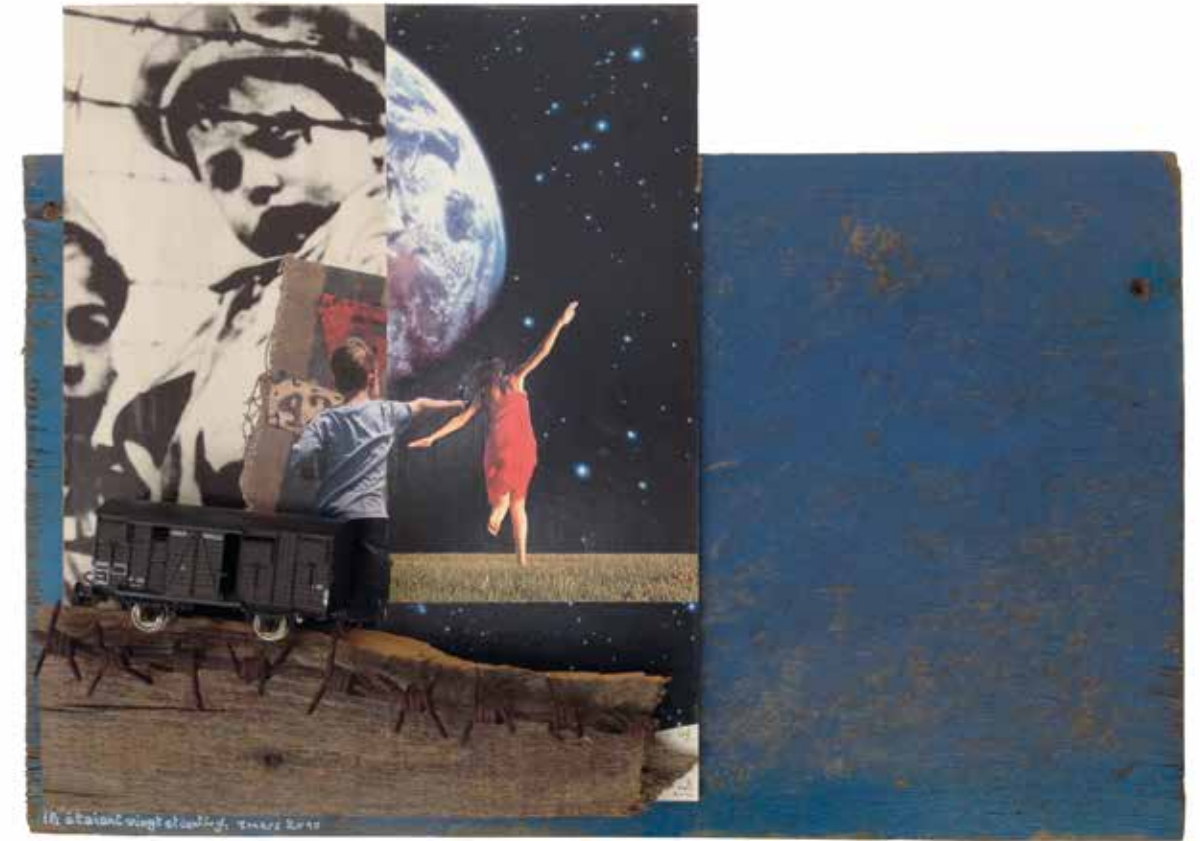
Ils étaient vingt et cent (8 mars 2012. Bois, papier, plastique, barbelés du camp de Rivesaltes)